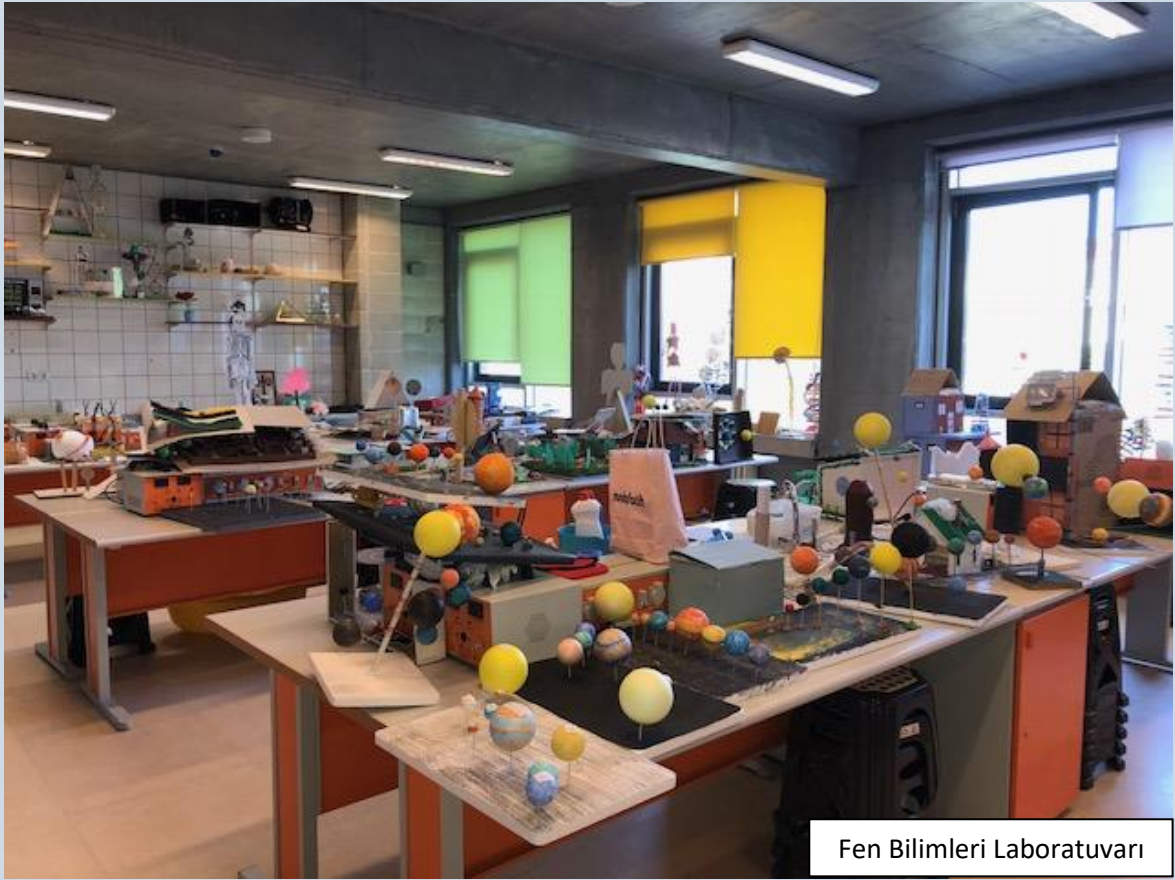
Fen Bilimleri Laboratuvarı