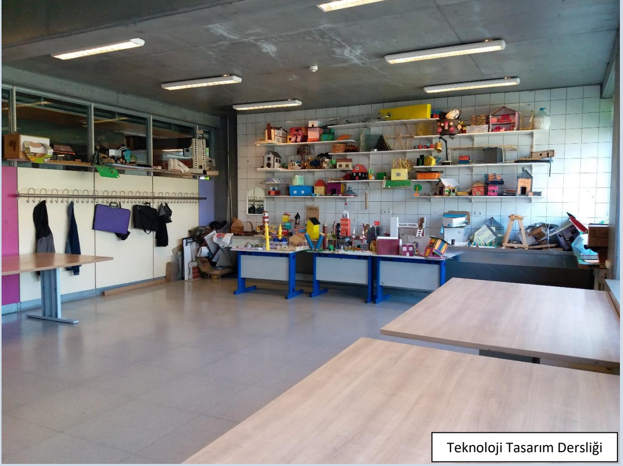
Teknoloji Tasarım Dersliđi