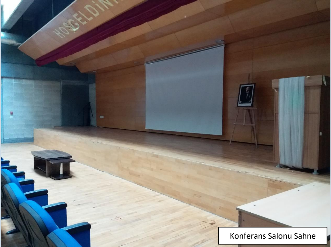
Konferans Salonu Sahne