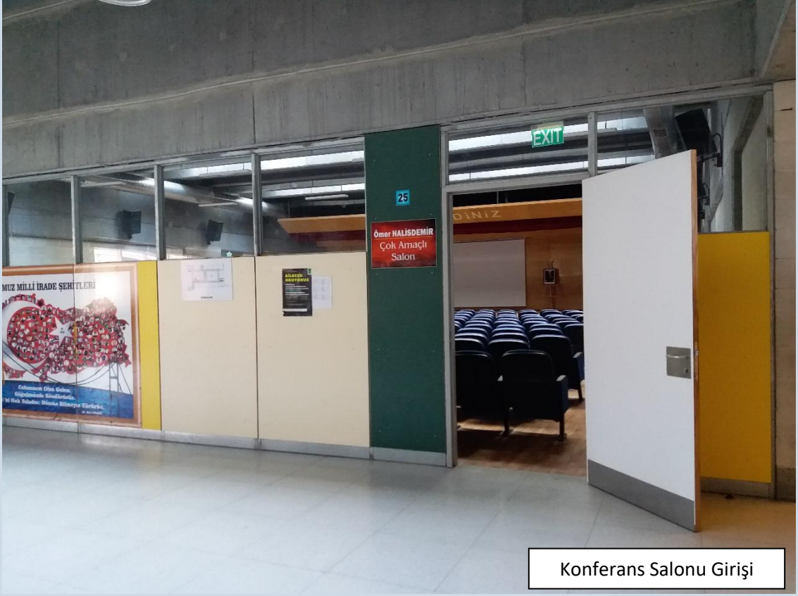
Konferans Salonu Giriş