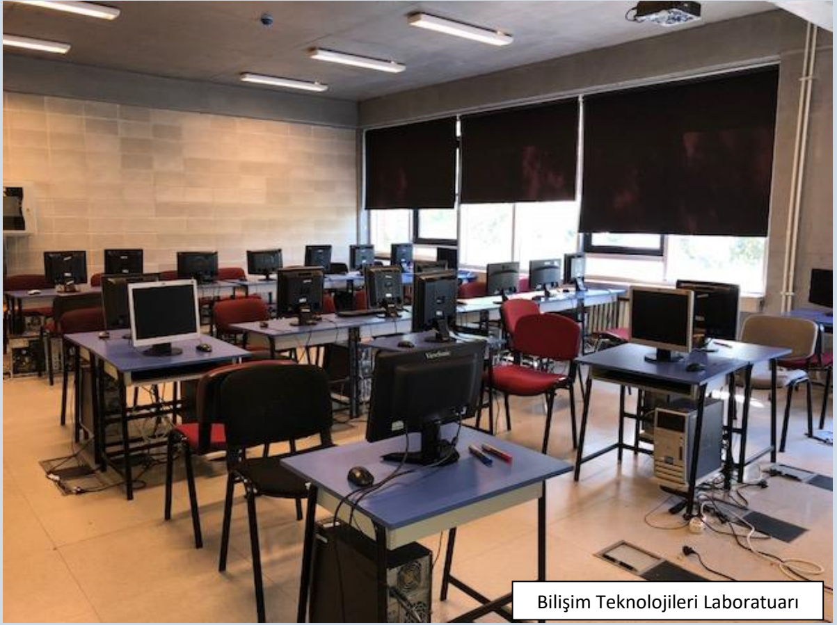
Bilişim Teknolojileri Laboratuvarı